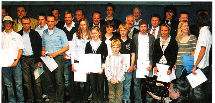
Die Meister aus Bayern auf einen Blick.

Week, die 2007 durchgeführten internationalen Meisterschaften aller olympischen Segelklassen, sowie der Behindertenklasse, auf dem Chiemsee, war trotz anfänglichem Windmangels eine große Werbung für den Segelsport“, so Hoermann.