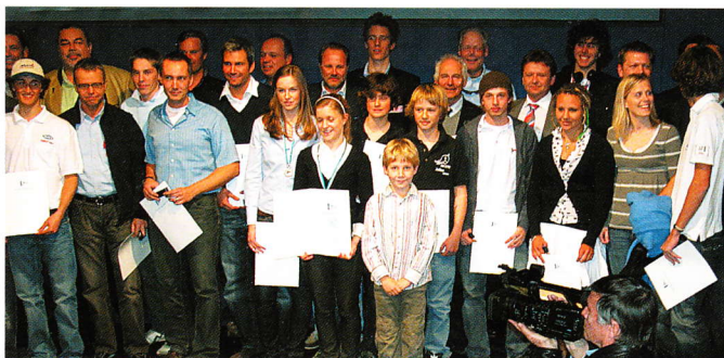
Die Meister aus Bayern auf einen Blick.

Week, die 2007 durchgeführten internationalen Meisterschaften aller olympischen Segelklassen, sowie der Behindertenklasse, auf dem Chiemsee, war trotz anfänglichem Windmangels eine große Werbung für den Segelsport“, so Hoermann.